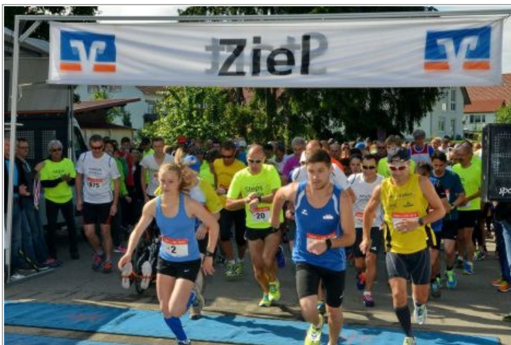
Allein beim sportlichen Race machten sich 137 ambitionierte Läufer auf den Weg.